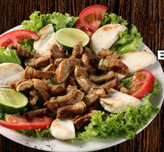
ENTRADA MIXTA CHUNCHULLA Y CHICHARRÓN