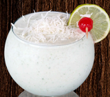
Limonada Coco $11.950