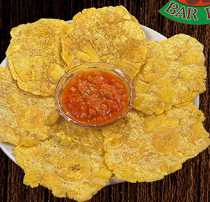
PATACONES CON HOGAO