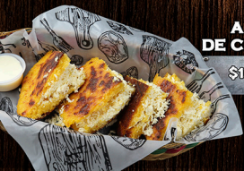
AREPA DE CHOCOBO