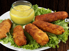
DEDOS DE QUESO APANADOS